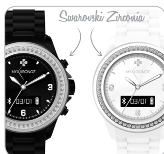
Set with 54 Swarovski Zirconia